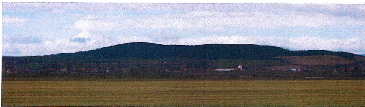
Widok na Księginice Wielkie i Wzgórza Dębowe