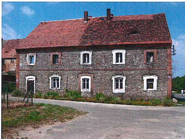
Dom z granitu w Czerwieńcu