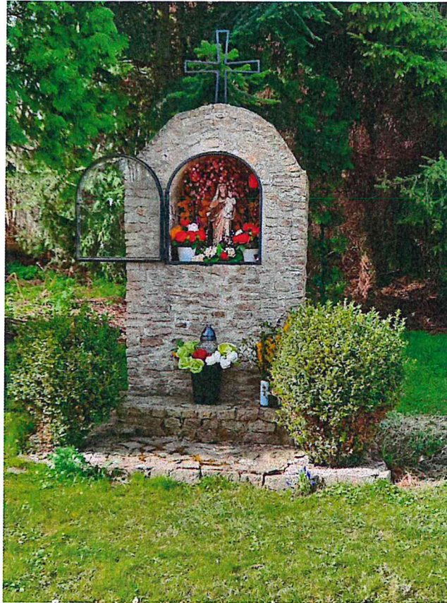
Kapliczka w Błotnicy