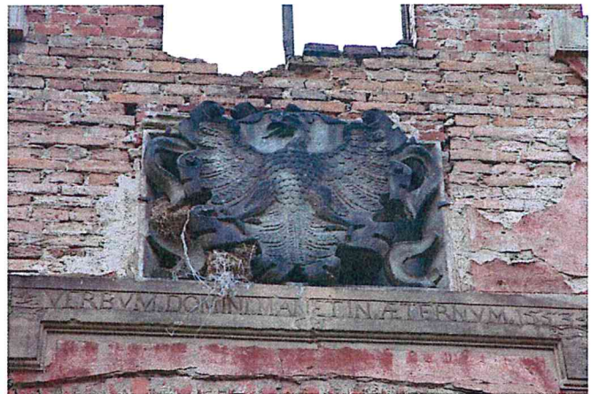
Ocalałe fragmenty portalu głównego – inskrypcja z 1553 r. i herb z XX w