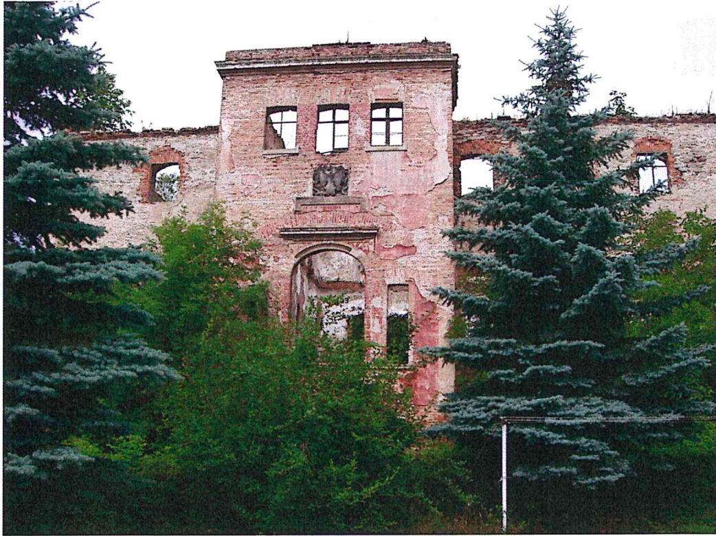
Pałac w Białobrzeziu, elewacja frontowa