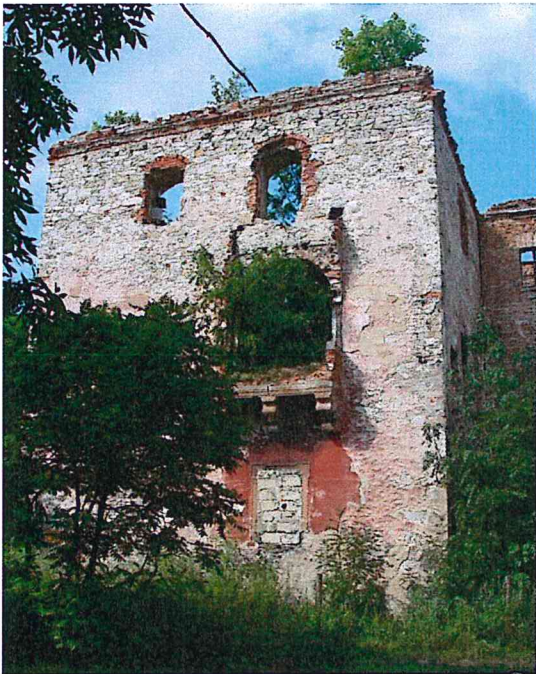
Ryzalit pałacu z zachowanymi resztkami wykusza