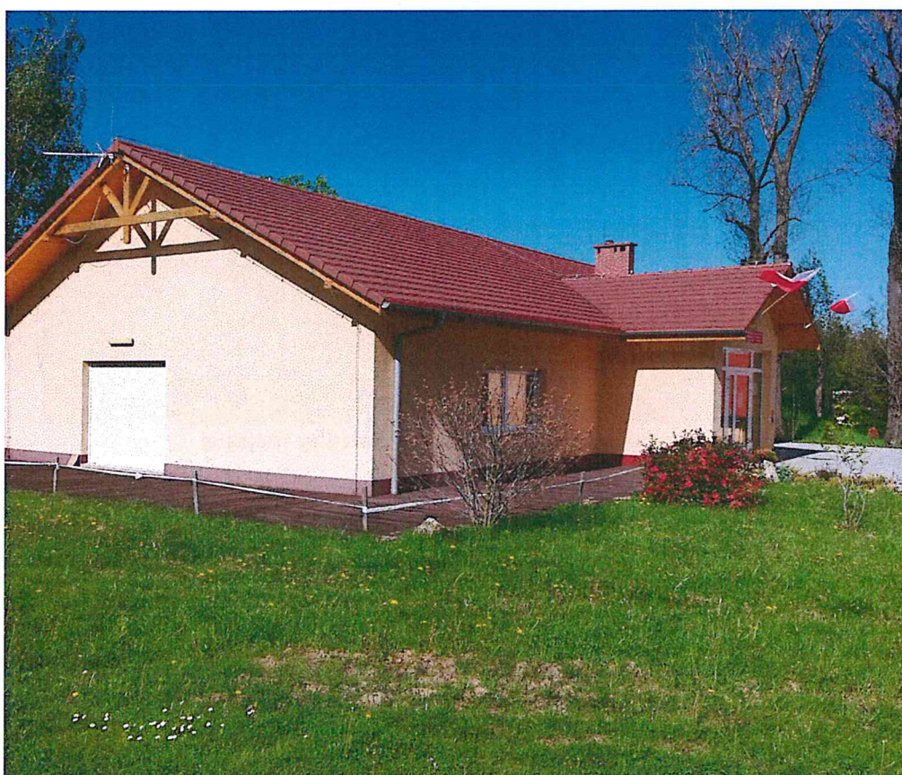
Budynek świetlicy wiejskiej w Stachowie