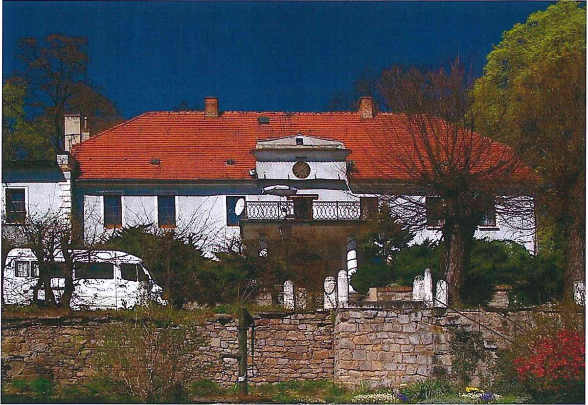
Pałac w Stachowie