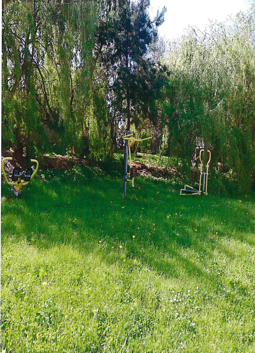
Siłownia zewnętrzna przy świetlicy wiejskiej