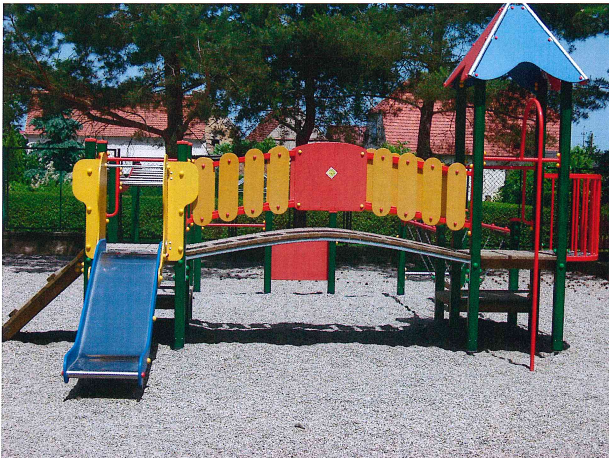
Plac zabaw w Stachowie