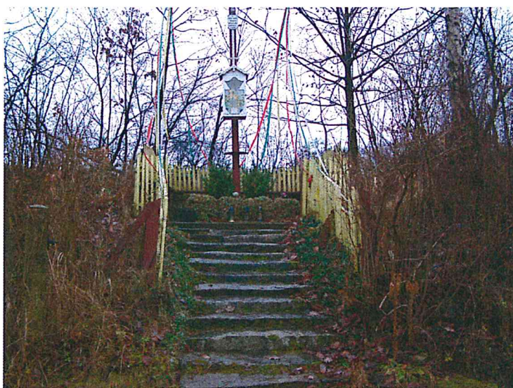
Kapliczka w Stachowie