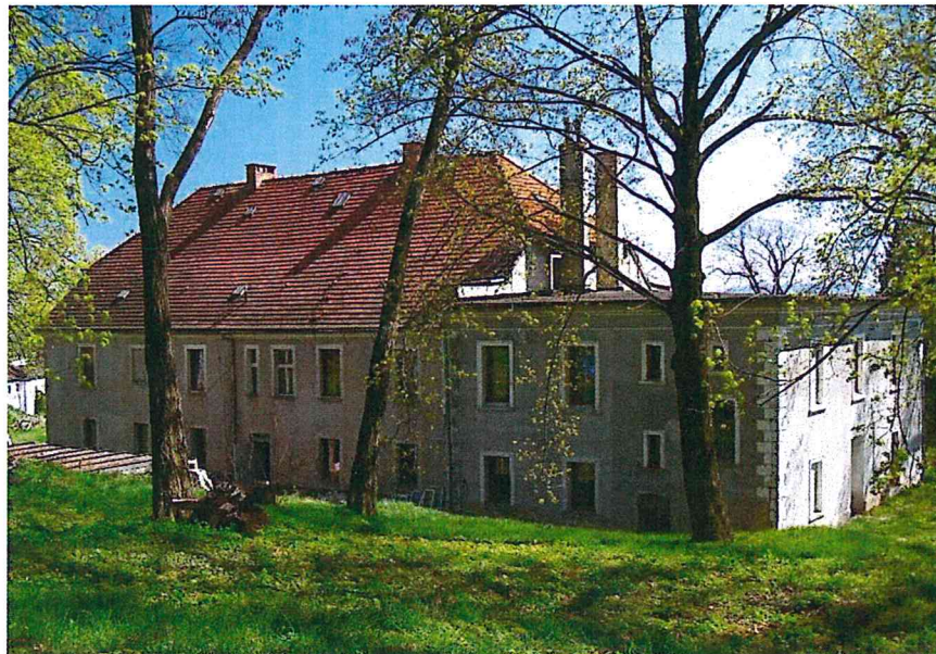
Pałac w Stachowie od strony parku