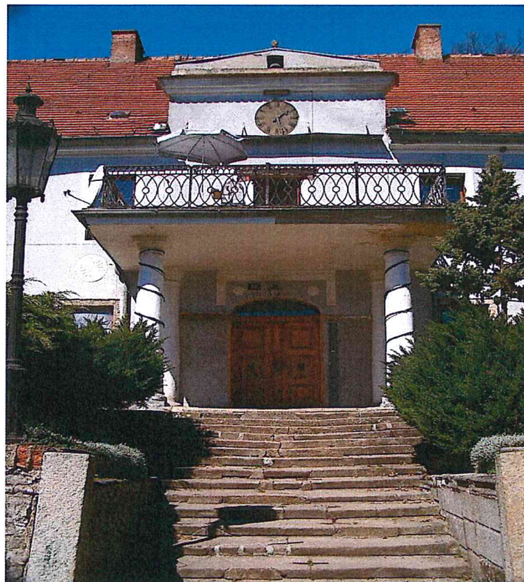
Fragment pałacu w Stachowie z widocznymi schodami i wejściem