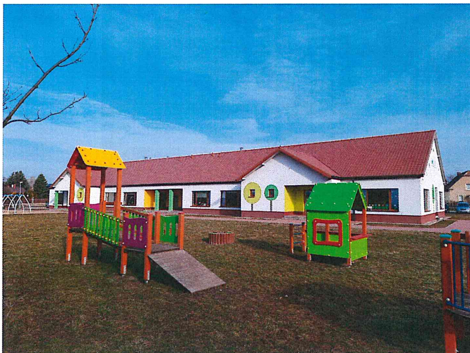
Przedszkole Publiczne w Kondratowicach