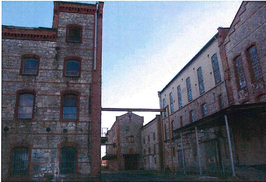
Z lewej strony najstarszy budynek z 1880 r. Po prawej stronie, jasna część nadbudowana w 1924 r. Prawie na wszystkich budynkach widnieje data budowy.