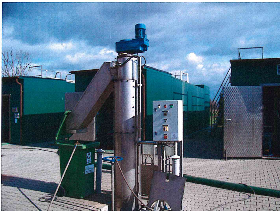
Oczyszczalnia ścieków w miejscowości Kondratowice