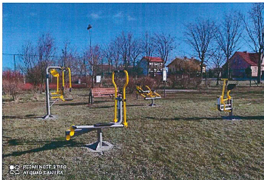
Siłownia zewnętrzna na boisku sportowym w Kondratowicach