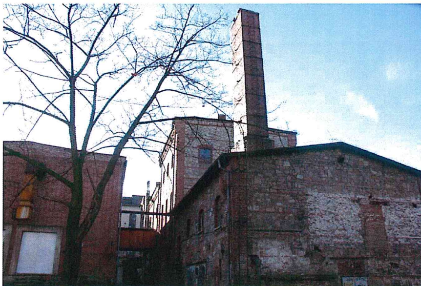
Najstarsze budynki mają elewacje kamienno-ceglane