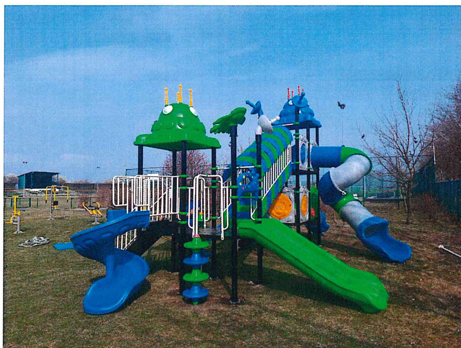
Plac zabaw na boisku sportowym w Kondratowicach