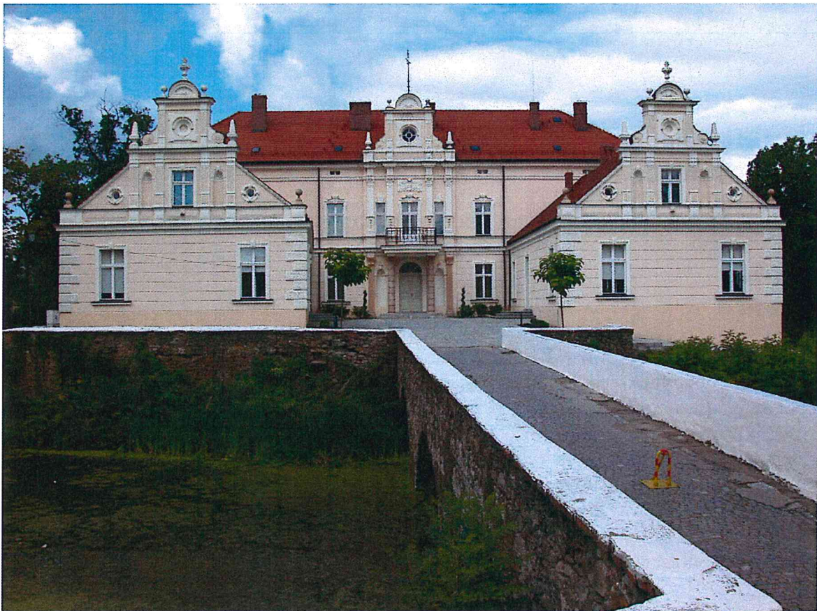
Piękne wejście główne do pałacu