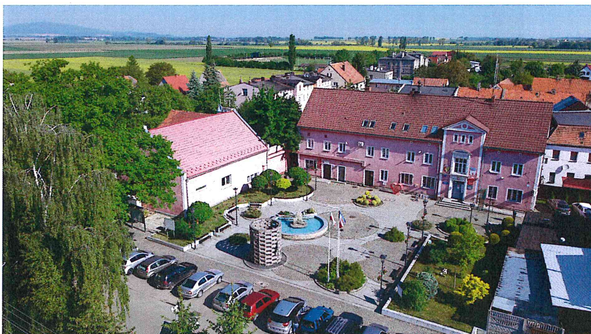
Budynek Urzędu Gminy