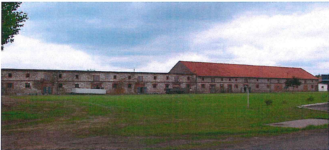
Gospodarcze zabudowania dawnego folwarku wykorzystywane obecnie przez firmę, która jest właścicielem pałacu