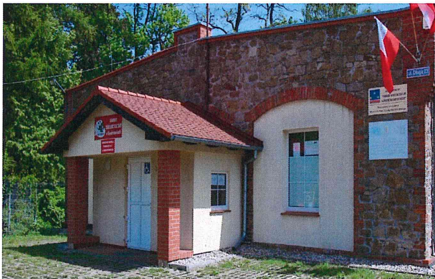
Gminny Ośrodek Kultury