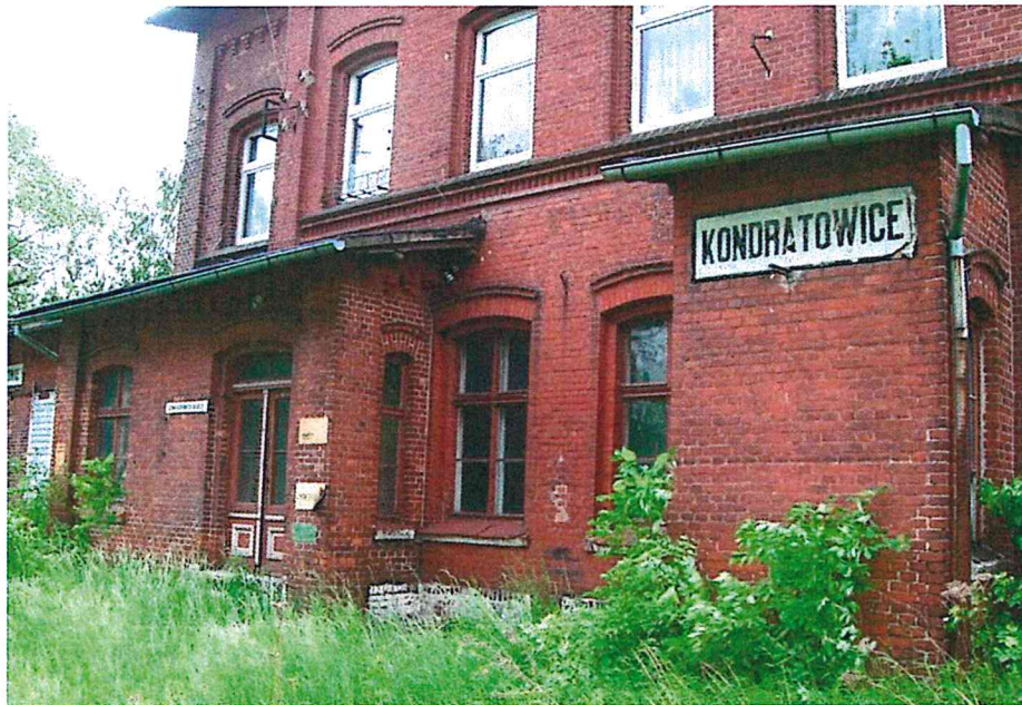
Nieczynna stacja PKP