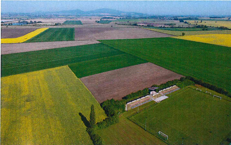
Boisko sportowe w Kondratowicach