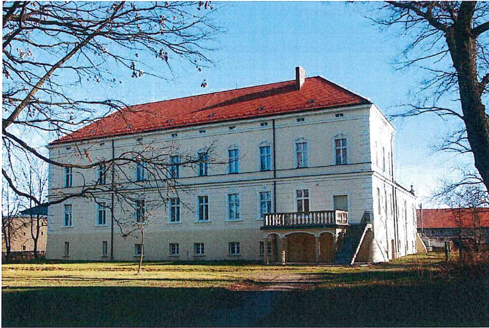
elewacja pałacu - od strony głównej drogi we wsi.