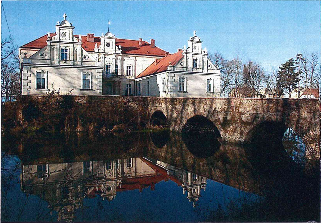
Pałac otoczony fosą. Kamienny most łączy główne wejście do pałacu z folwarkiem