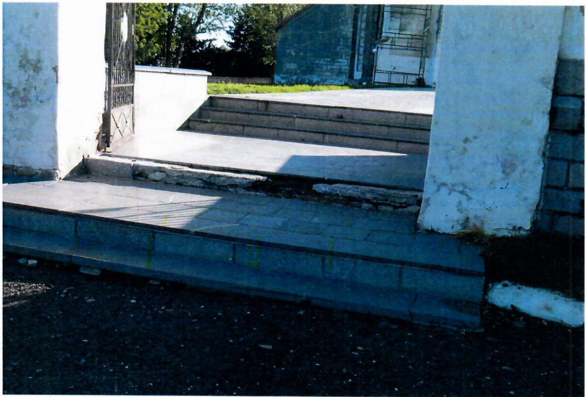
Fot. nr 2 Kościół Prusy – schody zewnętrzne – stan istniejący