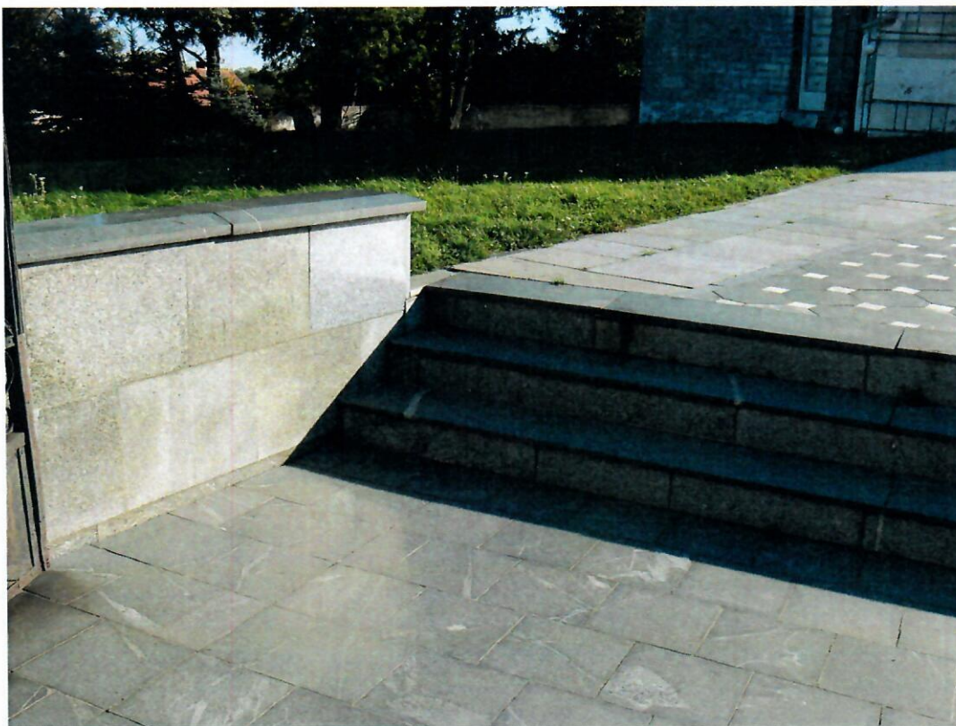
Fot. nr 5 Kościół Prusy – schody zewnętrzne – stan istniejący