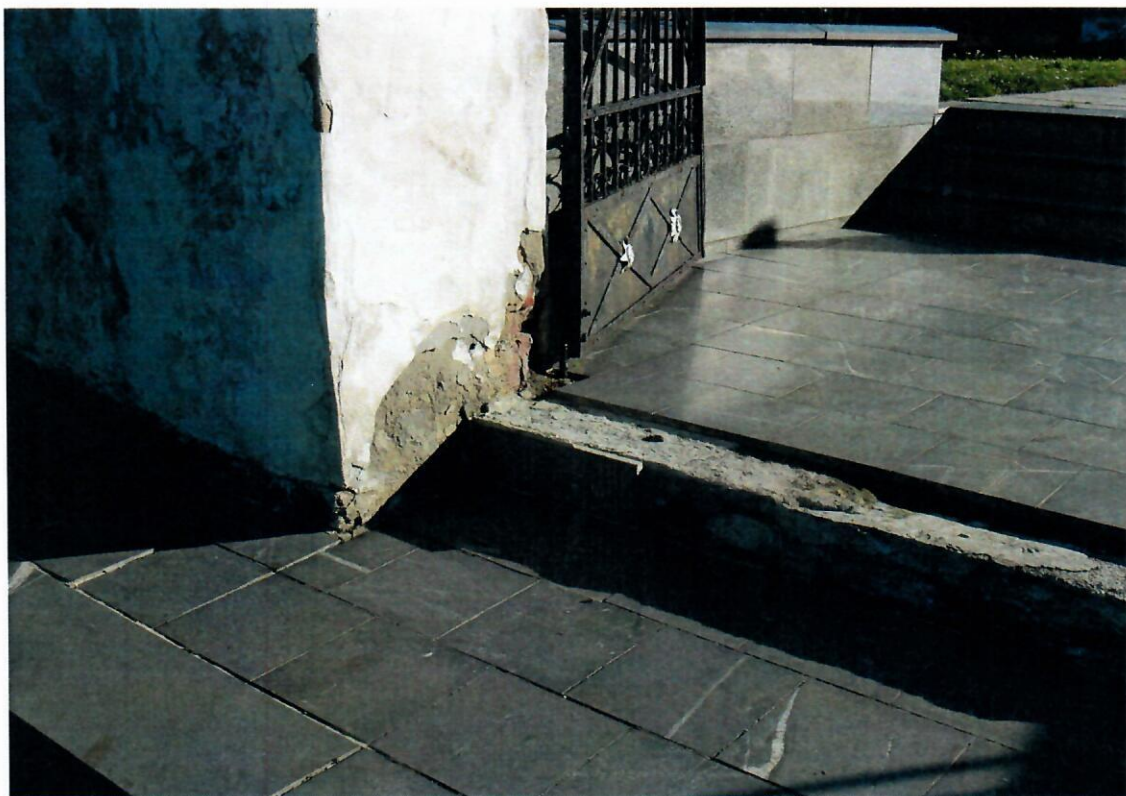
Fot. nr 3 Kościół Prusy – schody zewnętrzne – stan istniejący