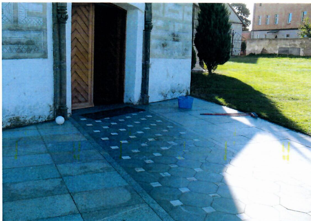
Fot. nr 8 Kościół Prusy – schody zewnętrzne – stan istniejący