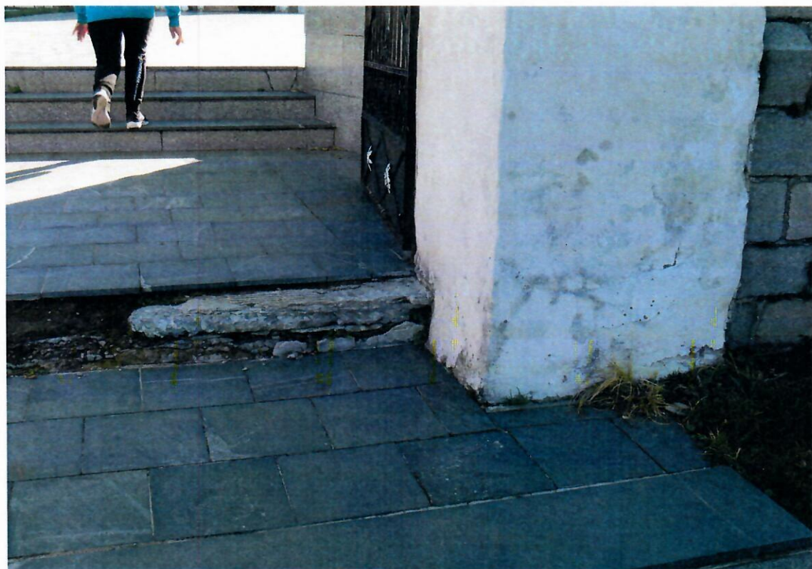
Fot. nr 4 Kościół Prusy – schody zewnętrzne – stan istniejący