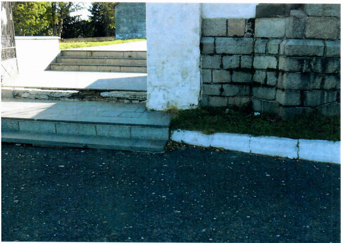
Fot. nr 1 Kościół Prusy – schody zewnętrzne – stan istniejący