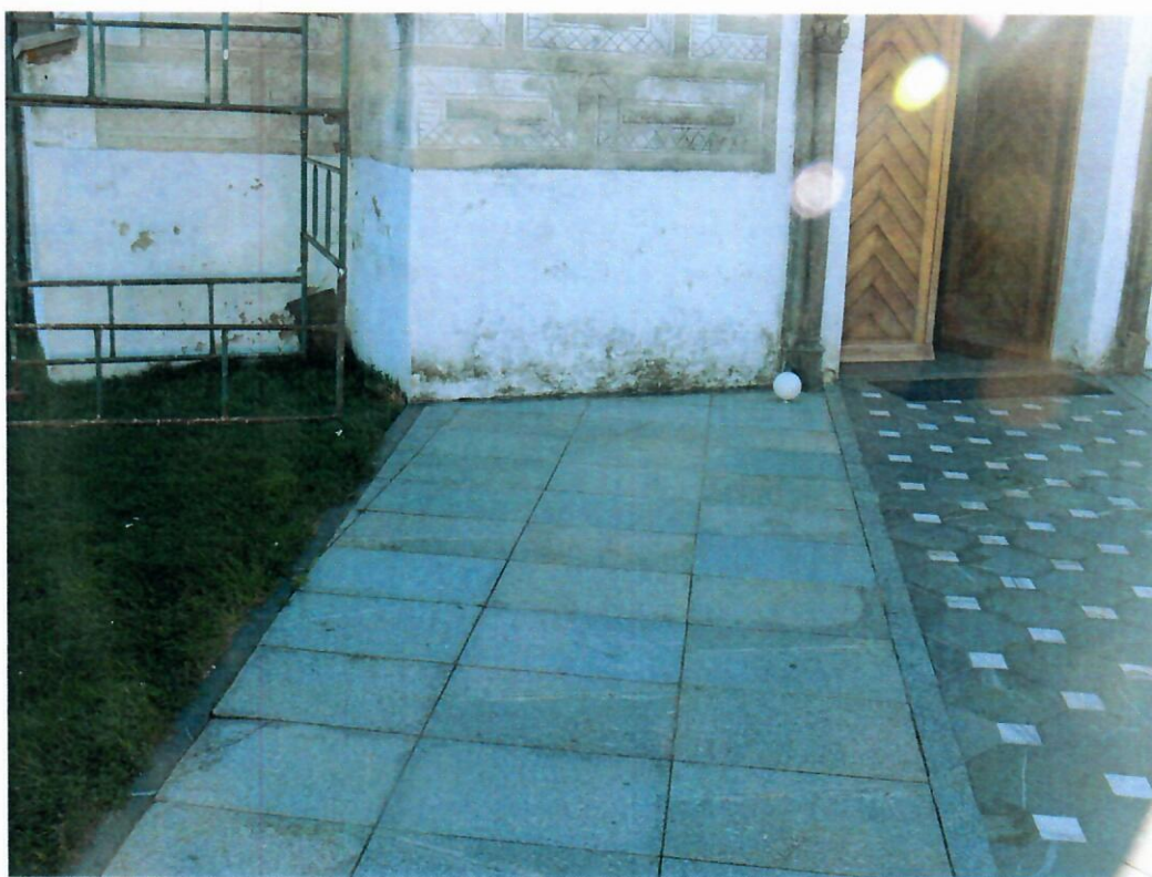
Fot. nr 7 Kościół Prusy – schody zewnętrzne – stan istniejący